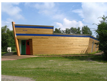
Sanitair gebouw De Potten Offingawier