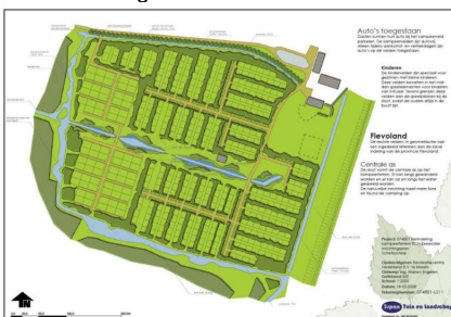
Kampeerterein RCN Zeewolde