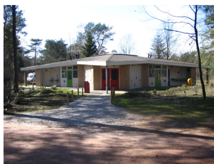
Sanitair gebouw "De Ster" De Noordster