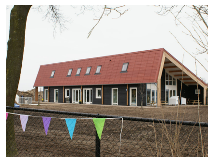
KDV De Mukkenstal, winnaar architectuurprijs 2013 gemeente Venray