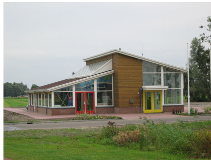
Receptiegebouw De Potten Offingawier