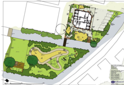
Buitenruimte KDV Elisabeth Hoeve