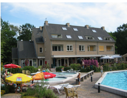
Centrumgebouw Bonte Vlucht Doorn