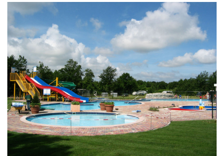
Zwembad De Schotsman te Kamperland