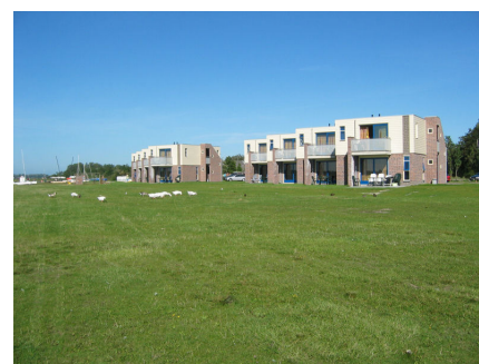
Appartementen De Schotsman

De Lucht Restaurants (A2) bij Zaltbommel