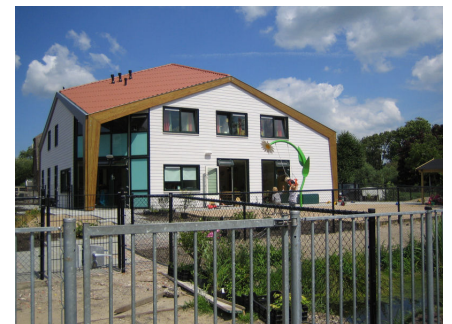
KDV Elisabeth Hoeve te Bodegraven