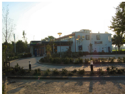
Restaurant De Lucht te Heesch