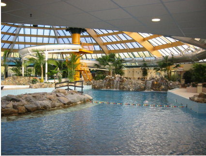
Zwembad De Lommerbergen te Reuver